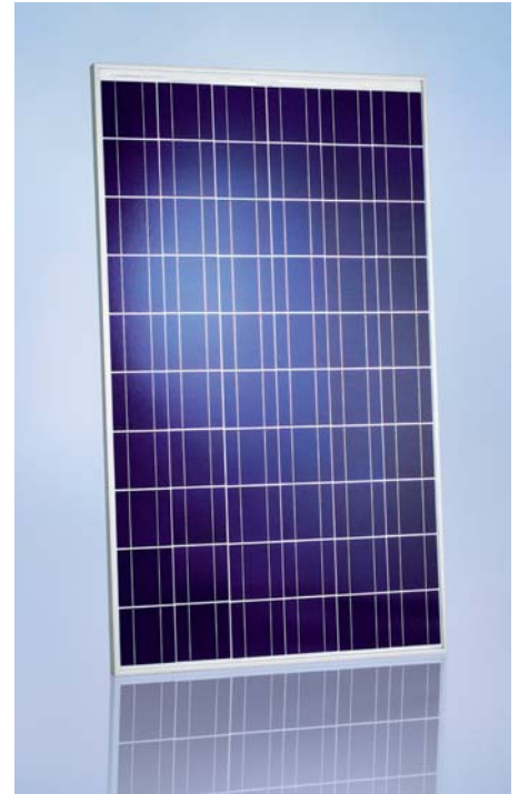
SCHOTT POLY™ 217/225/232