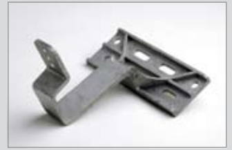
Verschraubung von vorne, 3-Loch