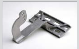
Verschraubung seitlich, 3-Loch