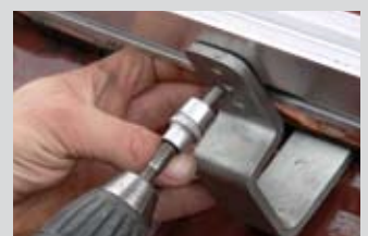
Bequemes Verschrauben der KLEMENS Profile von vorne