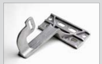
Verschraubung seitlich, Langloch