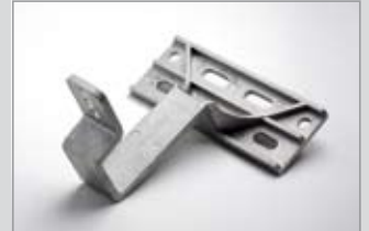
Verschraubung von vorne, Langloch