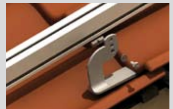
Montieren der AluVerPlus Schiene von der Seite