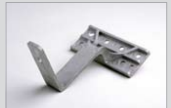
Verschraubung von vorne, Langloch