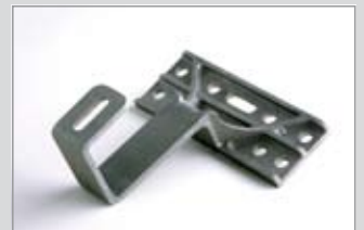
Verschraubung von unten, Langloch